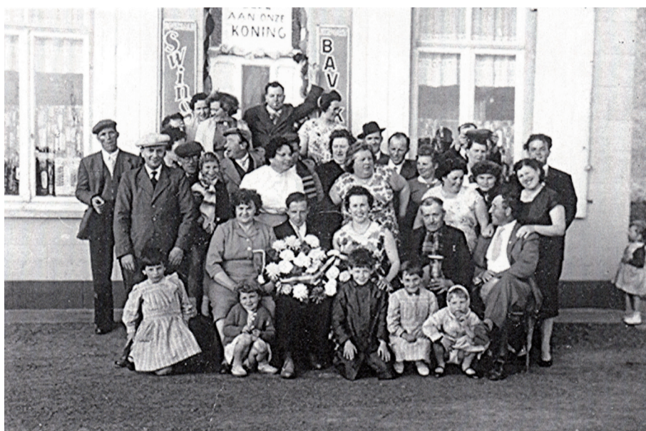
Naoorlogse koningsviering in De Villa