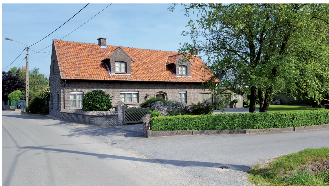
De huidige toestand

Op 14 augustus 1978 werd de kapel ingewijd. Hiermee werd de belofte voor de genezing van een blinde jongen volbracht.